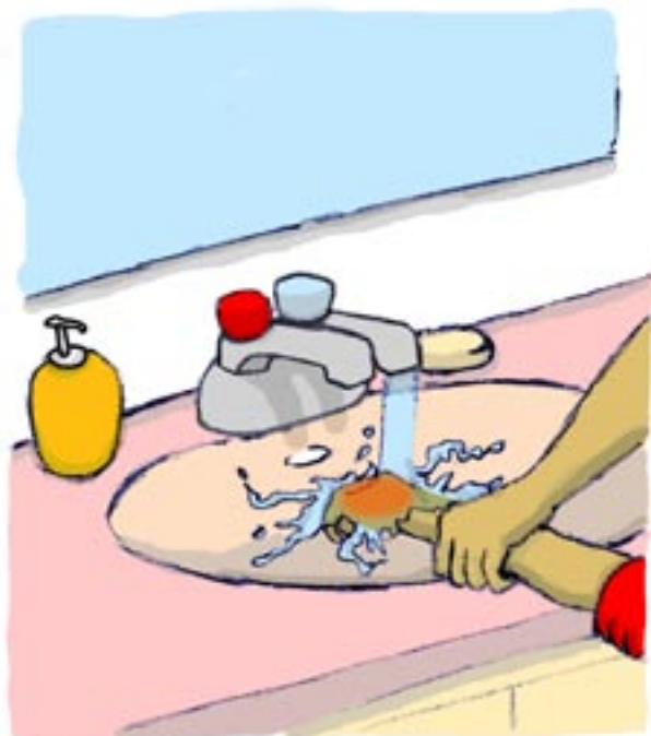
Whakarerea he wai makariri ki runga i te wāhi i wera mō te 10 ki te 20 mineti.